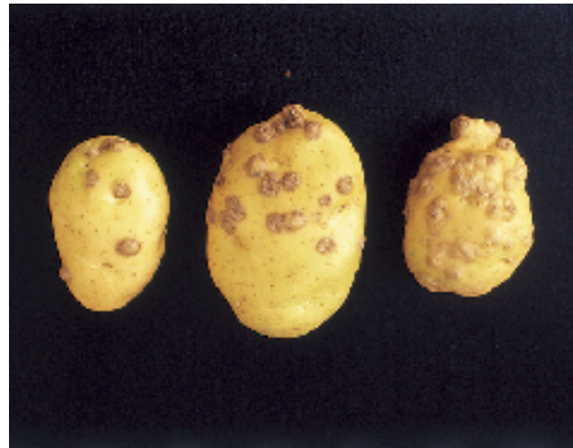
Figura 6. Tubérculos afectados por carbón mostrando síntomas de tumoración.

no queda espacio para el desarrollo normal de estolones y como consecuencia los rendimientos se reducen (Torres et al. , 1998).