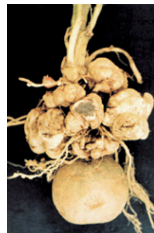
Figura 4. Tumores carbonosos desarrollados en el tallo subterráneo, producidos por diferentes puntos de infección.