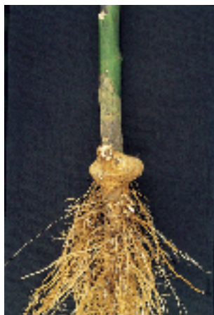
Figura 11. Tumor carbonoso desarrollado en el cuello de una planta de D. stramonium .