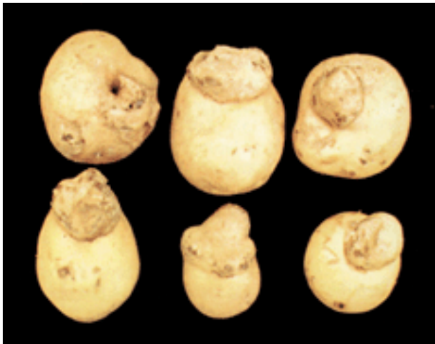
Figura 5. Tumores carbonosos desarrollados en tubérculos.