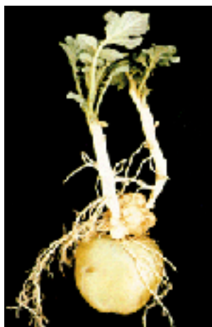
Figura 3. Tumor carbonoso desarrollado en la base de los tallos de una planta recién emergida.