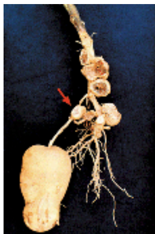
Figura 1. Tumores carbonosos desarrollados en el estolón y en la parte inferior del tallo.

Cuando los puntos de infección son numerosos, los tumores carbonosos se forman en toda la extensión del tallo que se encuentra próxima a la línea del suelo y que es la parte donde se originan los estolones (Figura 4), de esta manera