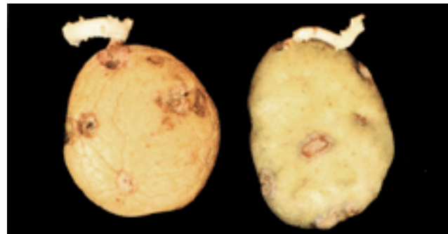
Figura 8. Tubérculos con lesiones hundidas y suberizadas, producidas en los mismos lugares donde inicialmente se mostraron como tumoraciones.

Cuando se almacenan tubérculos con síntomas de carbón con la finalidad de utilizarlos posteriormente como semilla, después de tres meses de almacenamiento, los tumores se convierten en lesiones hundidas y suberizadas (Figura 8).