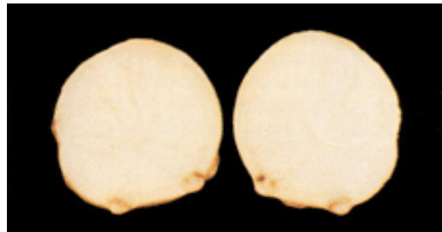
Figura 7. Tubérculo partido, mostrando la parte interna de dos tumoraciones.

2. Pequeños sobrecrecimientos o tumores que se desarrollan en la superficie de los tubérculos, aparentemente se presentan en algunas variedades más que en otras. Estos tumores ocasionalmente son confundidos con los síntomas causados por el nematodo del nudo ( Meloidogyne incognita ). Sin embargo, aunque se han encontrado asociados con este nematodo en la costa del Perú y en la Serena (IV Región, Chile), también se ha encontrado a altitudes de 3500 m en el Perú, donde el nematodo mencionado no prospera (Figuras 6 y 7).