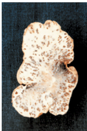
Figura 2. Corte transversal de un tumor carbonoso mostrando las soras dispuestas en forma de estrías.