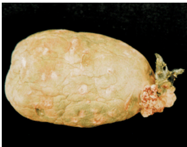
Figura 9. Tumor carbonoso desarrollado cerca del brote apical de un tubérculo con lesiones hundidas y suberizadas.

Angiosorus solani . El hongo se caracteriza porque forma una bolsa que contiene esporas multicelulares (de 2 a 8 células) de color marrón oscuro, cuya superficie externa tiene una capa delgada ligeramente verrucosa (Figura 10). La masa de esporas que se encuentra en las cavidades locales del tumor carbonoso es de color marrón oscuro y aspecto pulverulento. Esto es lo que se observa en forma de estrías cuando se cortan transversalmente los tumores carbonosos. El micelio del hongo tiene fíbulas, es grueso y toruloso.