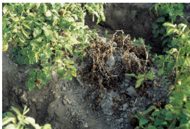
Figura 6. Planta sana y planta con síntomas de muerte temprana.

Brotos encorvados.- Este síntoma es producido por la especie V. nubilum . Los brotes afectados se muestran encorvados y algo retorcidos en la