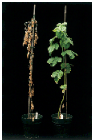
Figura 4. Planta testigo (izquierda) y planta desarrollada en suelo infestado con V. dahliae (derecha) mostrando muerte temprana y hojas muertas colgadas del tallo.