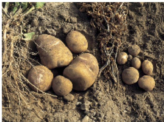
Figura 7. Tubérculos obtenidos de planta sana y tubérculos de planta con muerte temprana.