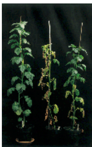
Figura 2. Planta Testigo (izquierda) y plantas con marchitez y clorosis desarrolladas en suelo infestado con Verticillium dahliae .