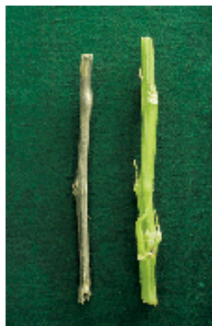
Figura 5. Tallo muerto (izquierda) de color grisáceo, debido al desarrollo de microesclerocios de V. dahliae y tallo sano (derecha).