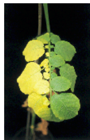
Figura 3. Hoja de una planta de papa desarrollada en suelo infestado con V. dahliae , mostrando en un lado, folíolos de color amarillo y en el otro, folíolos sanos.