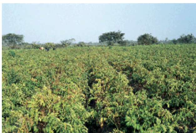
Figura 1. Marchitez y muerte temprana causados por Verticillium en un campo de papa en Cañete (Costa de Perú).

La marchitez unilateral y/o amarillamiento se observan también en las hojas y consiste en que los folíolos de un lado de la hoja se marchitan o se ponen amarillentos y los del otro lado permanecen sanos (Figura 3). A medida que la