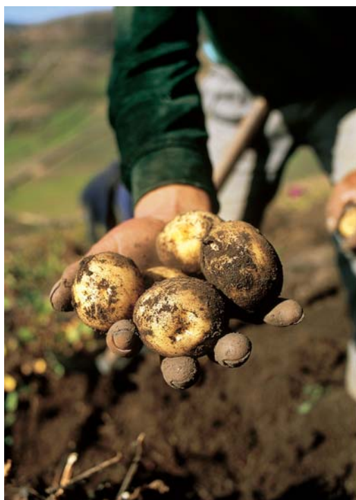
Abril, 2000. Cosecha en el Valle del Mantaro, Junín, Perú

La región andina ha sido cuna de muchas grandes civilizaciones, así como el centro originario de innumerables y valiosas plantas medicinales y comestibles. Ahora sabemos que los centros de diversidad y riqueza cultural se superponen a centros de agrobiodiversidad. Es justo entonces que la papa, que ocupa un lugar de eminencia entre los regalos biológicos de los Andes, sea producto de la estrecha relación entre el ser humano y la naturaleza.