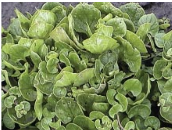
Figura 1.1. Follaje del melloco ( Ullucus tuberosus Caldas).

pero los más conocidos son "mellocos" y "ullucus"; solamente en Bolivia, se le conoce también como "papa lisa" (Acosta-Solís, 1980). En las localidades del Proyecto Integral (PI) Las Huaconas encontramos los siguientes nombres comunes para melloco: en la Comunidad Santa Rosa de Culluctús, rosado, amarillo, caramelo, caramelo largo gallo, jaspeado alargado, blanco, rosado largo, rojo, jaspeado bola, cocolón, soledad, bayo, clavel y clavel claro; en San Pedro de Rayoloma, rosado, quillu, caramelo, gallo lulo, puca y bronce; en Virgen de las Nieves, caramelo rosado, colorado rojo, blanco, gallo, lulo, chaucha, jaspeado, quita, caramelo, gallo pintón, gallo malva y rojo.