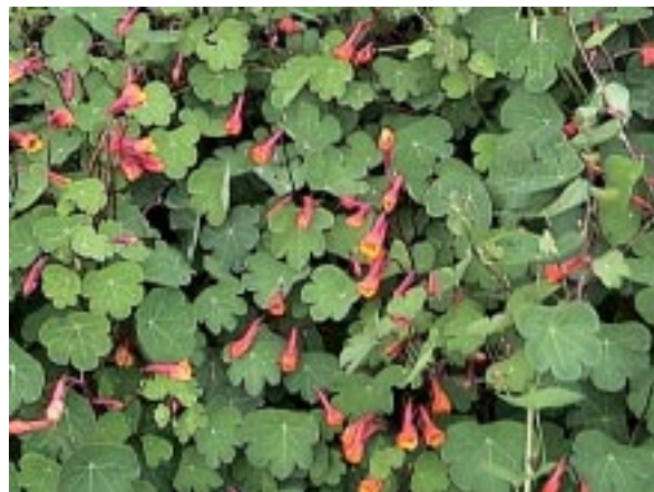
Figura 1.3. Follaje y flores de mashua ( Tropaeolum tuberosum R. y P.).

La mashua presenta innumerables nombres comunes que varían de acuerdo al país y al idioma, como, por ejemplo, nombres comunes recopilados en Monteros,