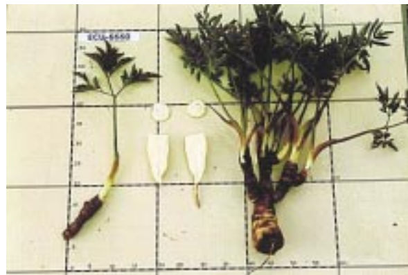
Figura 1.4. Morfología de zanahoria blanca ( Arracacia xanthorrhiza Bancroft).

la mayoría de las especies del género Arracacia (Bukasov, 1930, citado por Mujica, 1990; Cárdenas, 1969), con una mayor variabilidad genética en el sur de Ecuador (Oviedo, citado por Castillo, 1984). La zanahoria blanca es la única umbelífera domesticada en las Américas (Hermann, 1992) y posiblemente su domesticación ocurrió en Colombia (Mujica, 1990). Bukasov, en 1930, citado por Cárdenas (1969) y Mujica (1990), sugiere que la zanahoria blanca es la planta cultivada más antigua de América. Indican, además, que el cultivo habría empezado a desarrollarse en época preincaica, pues existen restos arqueológicos de tumbas incaicas que parecen representar a la zanahoria blanca; sugieren que su utilización entre los Chibchas de la meseta de Bogotá habría precedido al de la papa y el maíz.