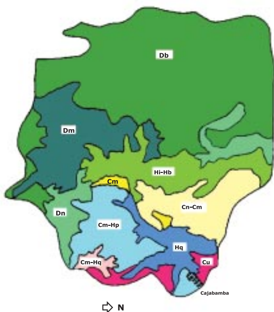
Figura 1.8. Mapa de suelos de la micro cuenca del río Sicalpa, Chimborazo, 1999.

Tipos de suelos. Según el Mapa de Suelos del Ministerio de Agricultura y Ganadería (MAG), 1981 ; en la Figura 1.8 se presentan las unidades de suelo de la micro cuenca del río Sicalpa, Las Huaconas , y sus características son: