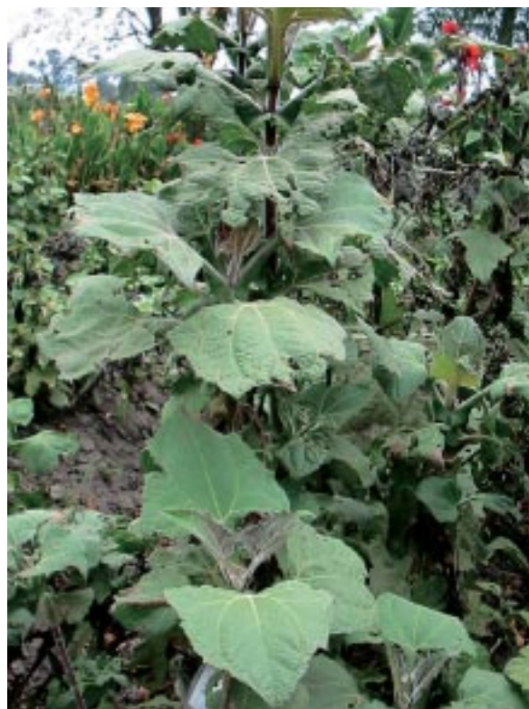
Figura 1.5. Follaje de jícama ( Smallanthus sonchifolius P. y E.).

La jícama pertenece a la familia de las compuestas, es originaria de los Andes y se distribuye desde Venezuela hasta el noreste Argentino. Las formas silvestres fueron encontradas por Bukasov en la meseta de Cundinamarca, en Colombia (FAO, 1992). En nuestro país, esta especie se cultiva desde los 2 100 hasta los 3 000 msnm, a lo largo de la Ceja Andina, zona en que las compuestas constituyen la familia más representativa. Crece en un amplio rango de suelos, con mejores rendimientos en suelos ricos y bien drenados (NRC, 1989). Puede encontrarse asociada con otros cultivos indígenas típicos de este piso altitudinal, como son el melloco, la mashua y la oca (Cañadas, 1983). Ha sido reportada en orden de importancia en las provincias de Loja, Azuay, Cañar y Bolívar (NRC, 1989).