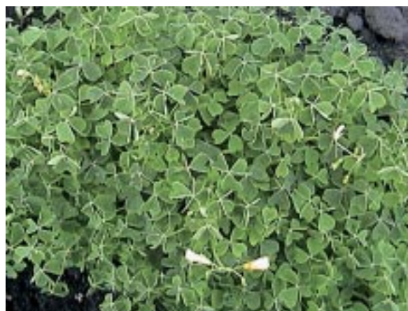
Figura 1.2. Follaje y flores de oca ( Oxalis tuberosa Mol.).

La primera descripción botánica de la oca fue realizada por el jesuita Giovanni Ignacio Molina (Mol.) en 1810. La palabra "okka" figura en el diccionario quechua de J. Lira (1982), y se refiere a una planta que produce tubérculos dulces y comestibles (Cárdenas, 1950).