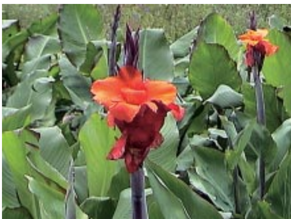
Figura 1.7. Follaje y flores de achira ( Canna edulis Kerl - Gawler).

La achira, es una monocotiledónea perenne de hasta 2,5 m de alto, es originaria de los trópicos americanos (León, 1987) y es muy probable que haya sido domesticada en la región andina (NRC, 1989), y se distribuye desde México hasta el norte de Chile.